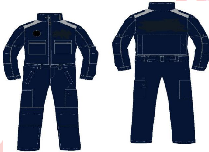
Ilustración 11. Mono de trabajo E.C.