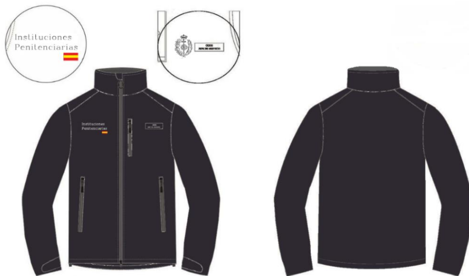
Ilustración 4. Forro soft Shell

Forro soft Shell , de color negro y navy, con corte diferenciado de hombre y de mujer, confeccionada en tejido soft Shell. Los dos delanteros izquierdo y derecho, estarán unidos por una cremallera principal invertida vista con dos cursores para apertura superior e inferior, la cremallera estará provista de un tirador personalizado en el cursor para agilizar y facilitar su apertura incluso con guantes. Ambos delanteros tendrán un bolsillo de apertura vertical lateral en la parte inferior de cada delantero y un bolsillo adicional de apertura vertical en el delantero izquierdo situado a la altura del pecho.