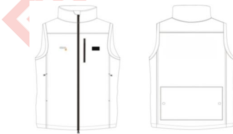
Ilustración 8. Chaleco E.C.