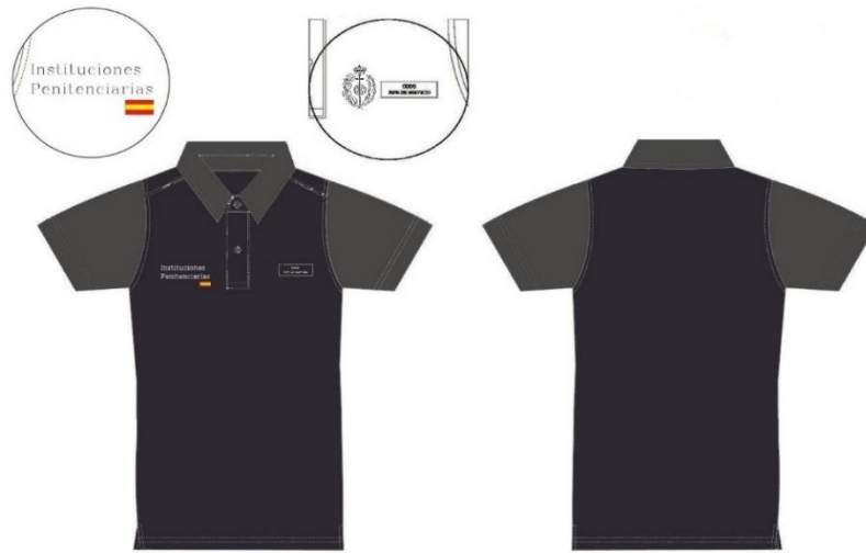
Ilustración 9. Polo manga corta