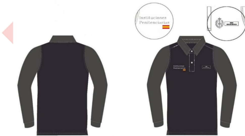
Ilustración 3. Polo de manga larga

Polo de manga larga , de color negro y navy. La prenda está formada por un delantero, espalda, pala, pie, pico, tapeta y mangas largas. Diferenciando entre hombre y mujer. Tejido técnico. A la altura del pecho derecho, se posicionará un transfer con el texto de Instituciones Penitenciarias y la bandera de España. En la personalización del pecho izquierdo se sitúa un astracán en con la finalidad de poder fijar la identificación con el número de carnet profesional y el cargo en genérico que se ocupa.