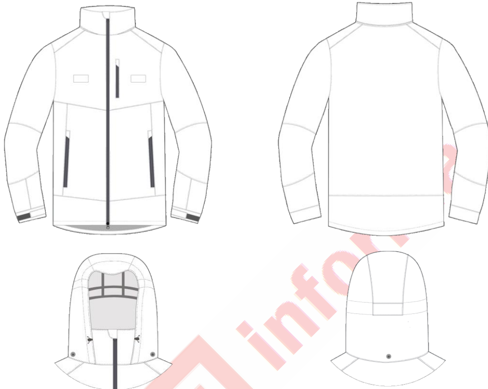
Ilustración 5. Chubasquero técnico

El canesú izquierdo llevará un bolsillo de acceso vertical, además llevará un astracán en el pecho izquierdo con la finalidad de poder fijar la identificación con el número de carnet profesional y el cargo en genérico que se ocupa.