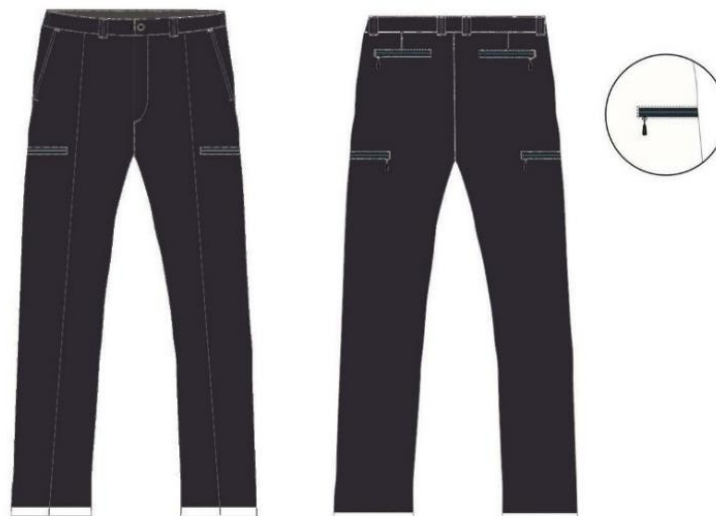
Ilustración 1. Pantalón todo tiempo

Pantalón todo tiempo , de color negro, diseño ergonómico, con corte diferenciado de hombre y mujer. La prenda dispone de dos piezas delanteras, dos piezas traseras, cinturilla, 5 trabillas, 6 bolsillos, de los cuales dos delanteros uno a cada lado, dos traseros y otros dos están dispuestos en los laterales. Tejido técnico.