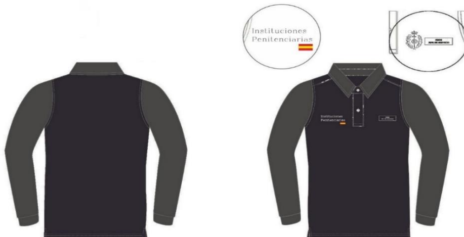
Ilustración 10. Polo manga larga.