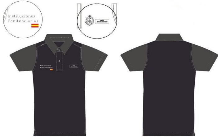
Ilustración 2. Polo de manga corta

A la altura del pecho derecho, se posicionará un transfer con el texto de Instituciones Penitenciarias y la bandera de España. En la personalización del pecho izquierdo se sitúa un astracán con la finalidad de poder fijar la identificación con el número de carnet profesional y el cargo en genérico que se ocupa.